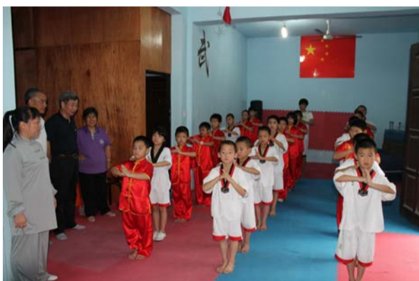
▲协会领导在义桥镇华天武道馆指导孩子们行抱拳礼