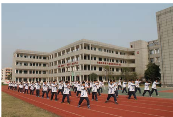
▲协会指导萧山区技工学校学生练习陈式太极拳