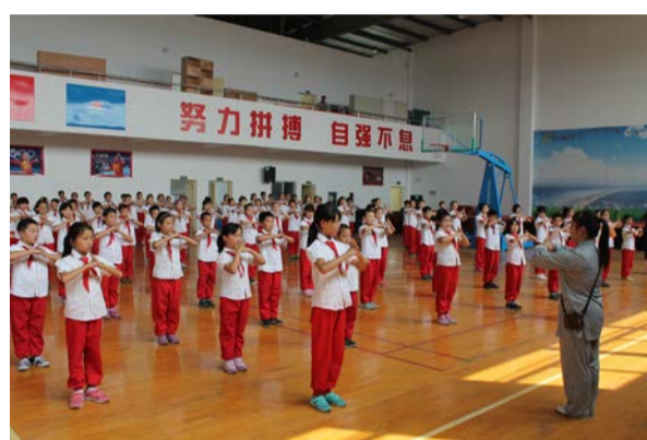
▲协会领导在益农镇第二小学指导学生们行抱拳礼