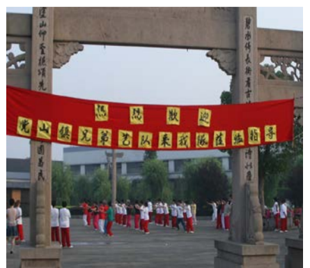
▲在绍兴安昌古镇联欢