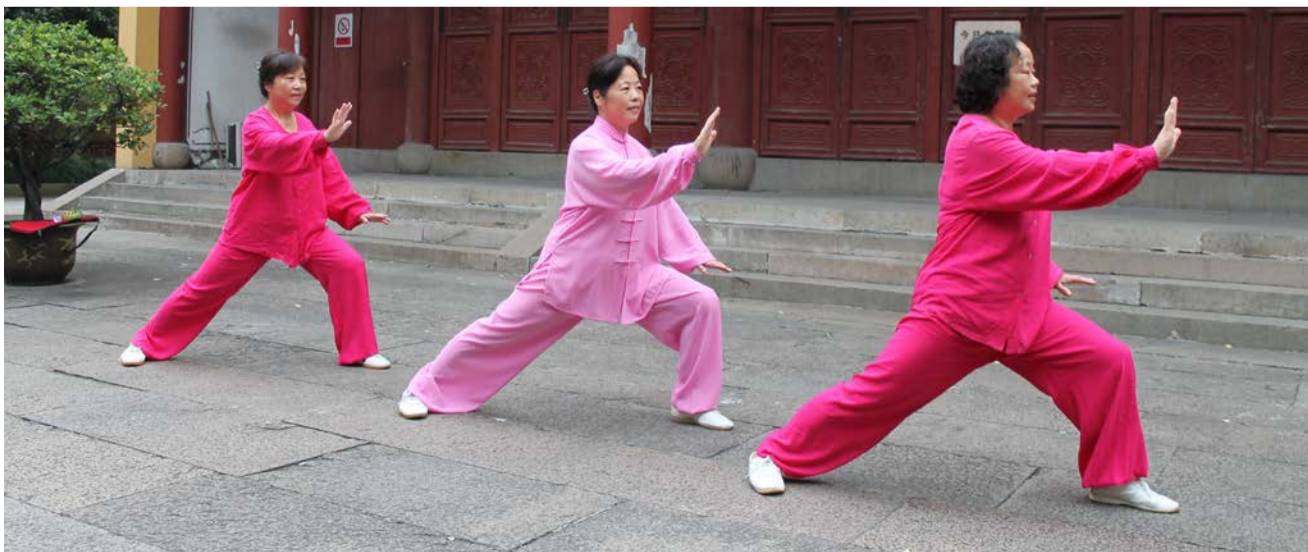
▲陆氏三姐妹在练武